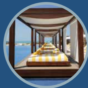
Furnishing Outdoor Furnishing